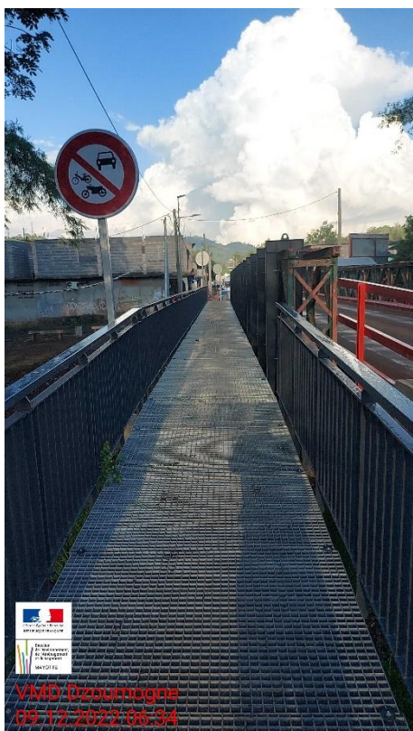
Passerelle et garde-corps

Une passerelle destinée aux piétons est venue compléter l'infrastructure afin d'offrir aux usagers un cheminement dédié ce qui n'était pas le cas à l'origine. Des aménagements particuliers ont dû être mis en place (rampes, gardes corps) pour sécuriser ce nouveau passage et faire le lien entre les deux rives du cours d'eau.