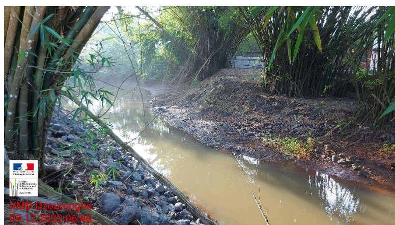
Passage à gué supprimé coté CEI DEAL

Les phases de travaux qui ont suivi ont permis de remettre les terrains en état conformément à leur destination d'origine. Ainsi les deux passages à gué ont notamment été supprimés et le lit du cours d'eau reconstitué. Le centre d'exploitation de la DEAL, qui avait accueilli les installations de chantier, a également été réhabilité.