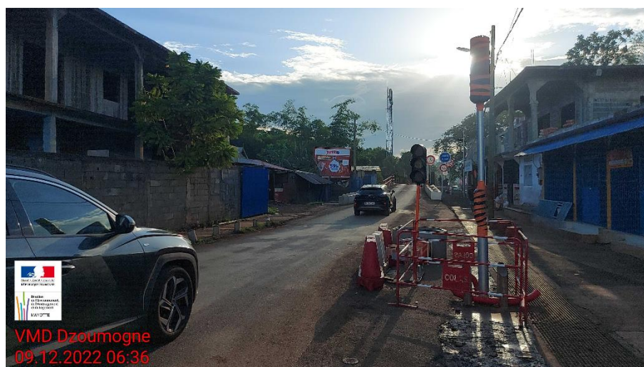
Les feux provisoires et définitifs (en attente de mise en service)

Enfin des feux provisoires ont été mis en service pour réguler le trafic en fonction des flux pendulaires constatés au fil de la journée. Ils seront remplacés avant la fin du mois de décembre par les feux définitifs « intelligents » (déjà en place mais en attente de raccordement au réseau électrique).