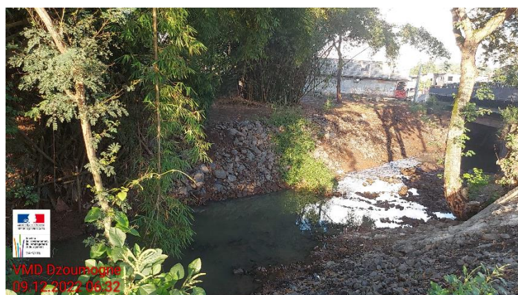
Passage à gué supprimé en amont de l'ouvrage